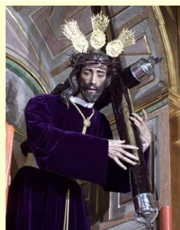
Ntro. Padre Jesús Nazareno

de mayor intensidad de la Pasión alcazareña sea la estancia de los pasos en la iglesia de Nuestra Señora de la Asunción antes de la estación penitencial de la madrugada. En esos instantes irrepetibles pero que retornan cada año, los titulares se encuentran acompañados por hermanos nazarenos con luz; son los turnos de vela.