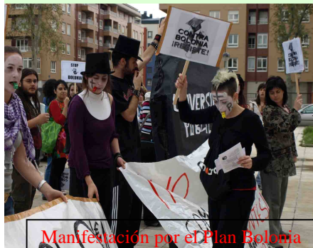
Manifestación por el Plan Bolonia

algunas universidades y carreras, y se puede escoger entre el plan antiguo o el de Bolonia. En el curso 2010 - 2011 ya se impondrá de forma definitiva sin posibilidad de acogerse al plan antiguo.