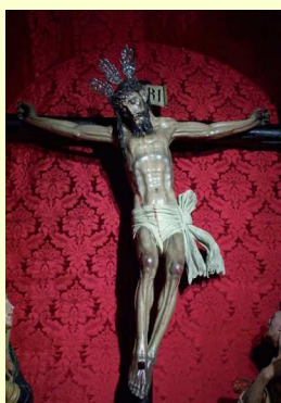
Cristo del Buen Fin

Esperanza, el jueves Santo le toca el santo turno a la Cofradía de Cristo de la Vera Cruz y Nuestra Señora de las Angustias, el Viernes Santo sale a la calle el Santo Entierro y Nuestra Señora de los Dolores en su Soledad.