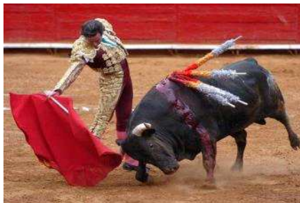
¿Socorren al toro cuando el torero le hiere?

bravo está hecho para ser toreado, que sin el toreo desaparecería, a lo que yo reprocho que ningún animal nace para padecer en el