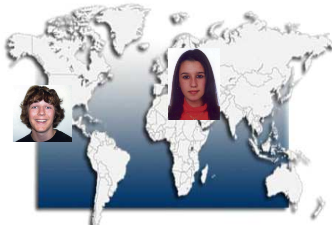
Un "charco" demasiado extenso y profundo.